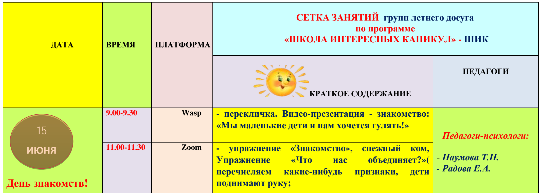
График работы групп досуговой занятости в МОУ ИТЛ №24 г.Нерюнгри в дистанционном формате